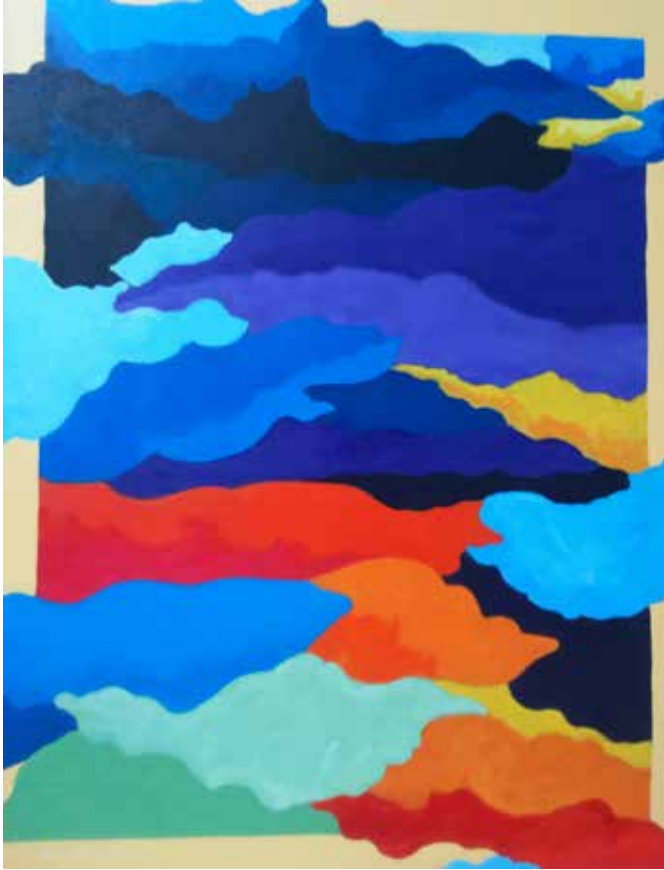
VLADIMIR GONZÁLEZ Preludio a la siesta del fauno , 2014 Acrílico sobre tabla 90 x 70 cm