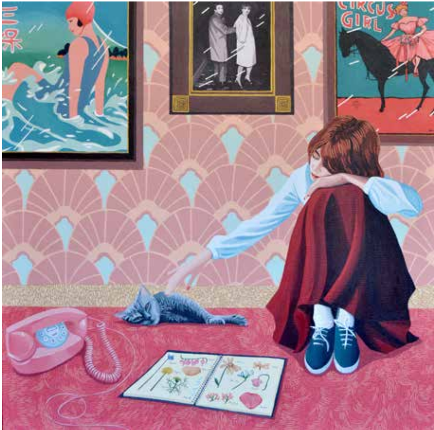
HELENA TORAÑO Espero tu llamada , 2018 Acrílico sobre lienzo 70 x 70 cm