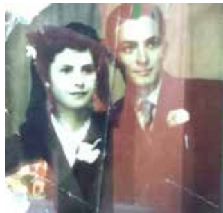
ROCÍO PINÍN Volver a empezar , 1981 Técnica mixta 20 x 30 cm