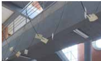
CÉSAR RIPOLL Participas , 2018 Tela, papel y tinta Medidas variables