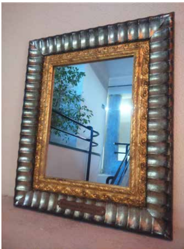
FERMÍN SANTOS Autorretrato de D. Miserable, Hipócrita y Cruel, 2018 Técnica mixta 62 x 52 cm