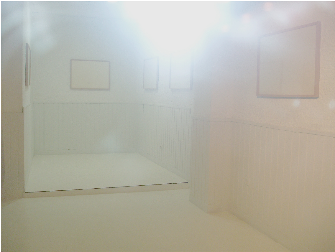
Detalle de la instalación IMÁGENES EVOCACIONALES en salalai