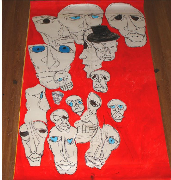
HARLEM © | Ivan Fernández González